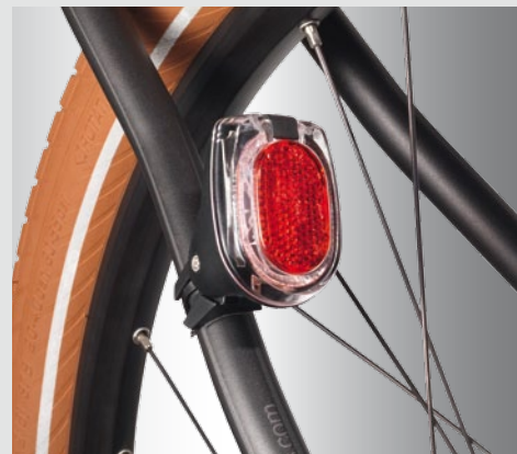
Montiert per Spannband an der Sattelstrebe, Sattelstützenmontage möglich (331/2ASK UVP 22,90 €)