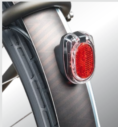
Montiert per Schraube am Schutzblech (331/ASK UVP 19,90 €)