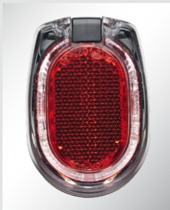
SECULA. Nur 55 mm hoch

In Auslieferung: SECULA, das neue Rücklicht für die Schutzblech- oder Strebenmontage. Die umlaufende Klarglas-Optik leuchtet in Funktion dank des LineTec-Prismensystems als Lichtkranz rot und strahlend hell. Natürlich mit Standlicht.