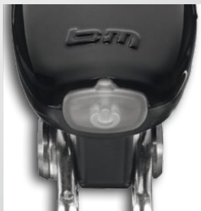
Der Drucktaster - hinterleuchtet mit LED-Funktionsanzeige