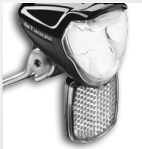
Rückstrahler liegt bei und kann einfach angesteckt werden.

Edelstahlhalterung: Besonders schlank - passend zum filigranen Design