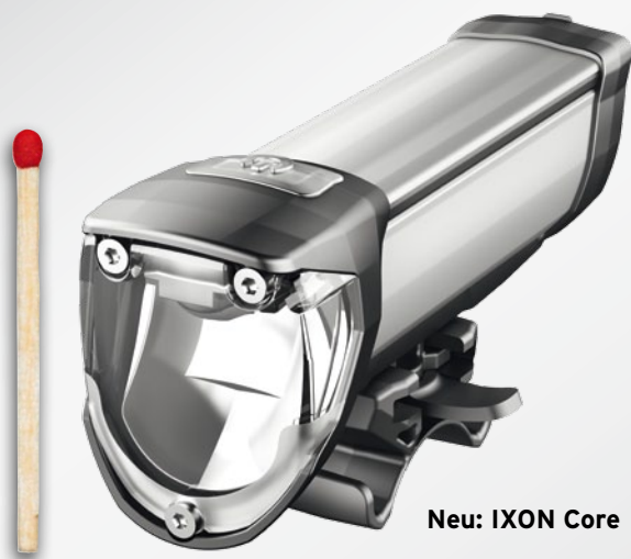
Neu: IXON Core