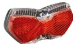
View E Typ 331ASDC