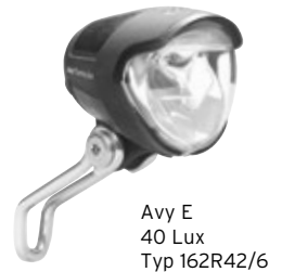
Avy E 40 Lux Typ 162R42/6