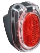
SECULA E Typ 331ASDC