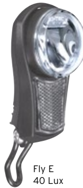
Fly E 40 Lux Typ 174Q42/6N