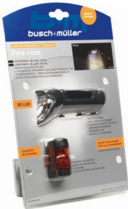
IXON Fyre + IXXI Typ 195L/383