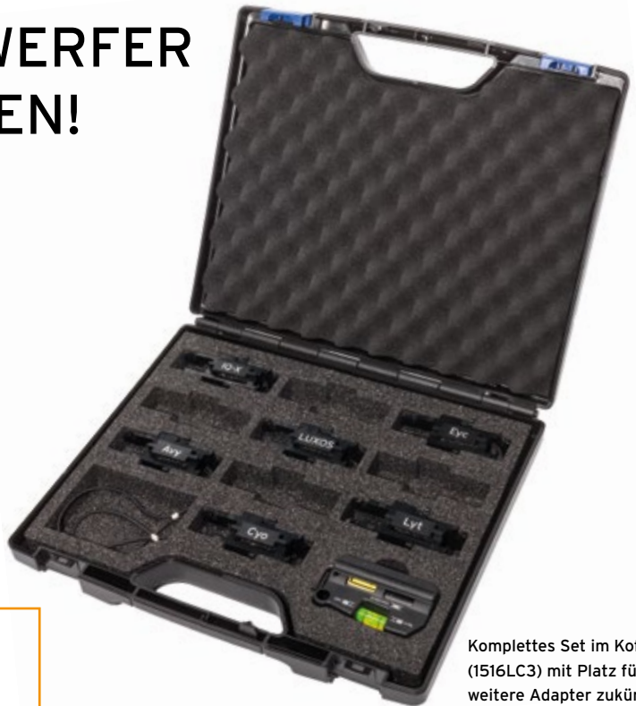
Komplettes Set im Koffer (1516LC3) mit Platz für weitere Adapter zukünftiger Modelle.