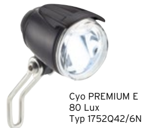
Cyo PREMIUM E 80 Lux Typ 1752Q42/6N