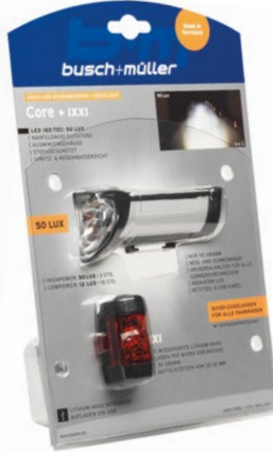
IXON Core + IXXI Typ 180L/383