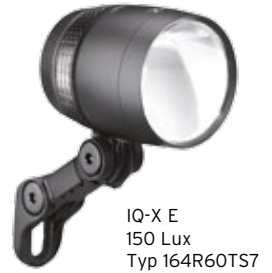
IQ-X E 150 Lux Typ 164R60TS7