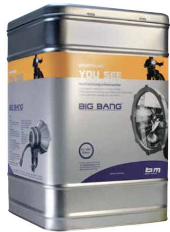
BIG BANG in fester Metalldose