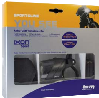
IXON Speed in hochwertiger Verpackung