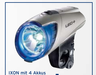
IXON mit 4 Akkus

„Eins-zwei-drei-fertig“ ist die weltweit einmalige RIDE&CHARGE Kombi: Lampe IXON plus elektronischer Weiche plus handelsüblichem Nabendynamo.