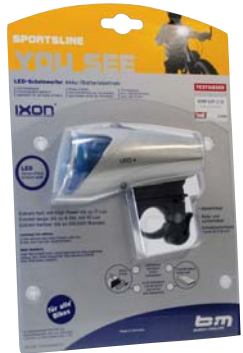
IXON in Kunststoffschale