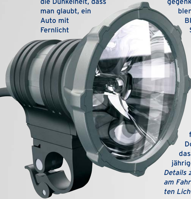
BIG BANG - hell wie ein Autoscheinwerfer

Diese Überschrift haben nicht wir erfunden. Sie stammt aus der Fachpresse, die über den BIG BANG schreibt: „Die Nacht erwacht ... Der BIG BANG knallt tatsächlich eine Lichtschneise in die Dunkelheit, dass man glaubt, ein Auto mit Fernlicht