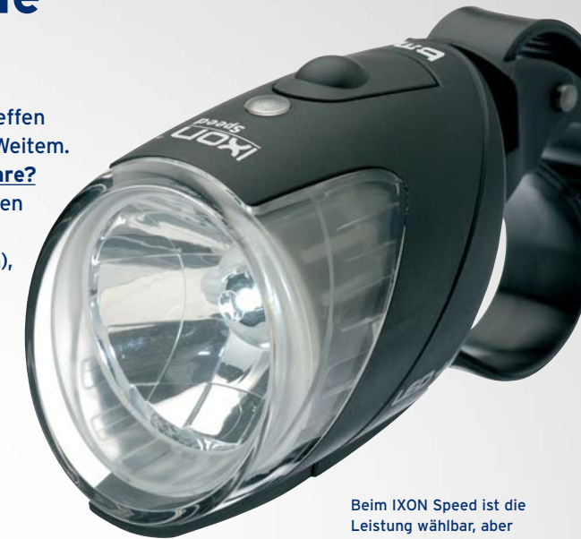
Beim IXON Speed ist die Leistung wählbar, aber nie zu wenig: 10 Std. mit 18 Lux oder 15 Std. mit 10 Lux

unsere Scheinwerfer übertreffen die Mindestanforderung bei Weitem. Was geschieht mit alter Ware? Scheinwerfer, die nur die alten Limits erreichen (4 Lux bei Glühlampe, 7 Lux bei Halogen), dürfen von Herstellern oder Importeuren nicht mehr gebaut oder ausgeliefert werden. Lagerbestände im Handel dürfen noch abverkauft werden.